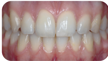
Voor de behandeling