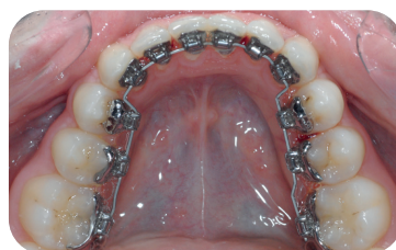
apparatuur aan de binnenzijde