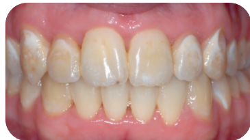
Voor de behandeling