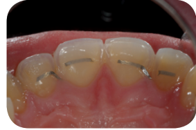
Retentiedraad is stuk