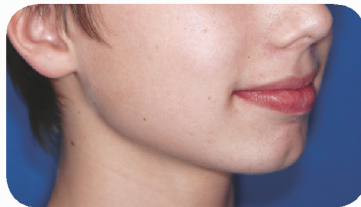
Voor de functionele behandeling