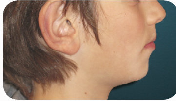
Voor de functionele behandeling